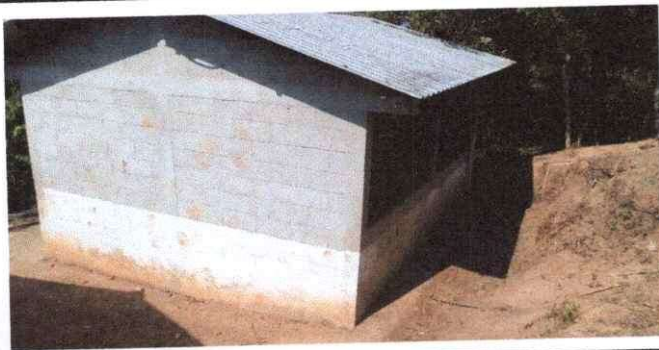
Foto 5: se observa modulo de cocina pared expuesta a la humedad y desprendimiento de pinturas con necesidad de mantenimiento en el modulo 2