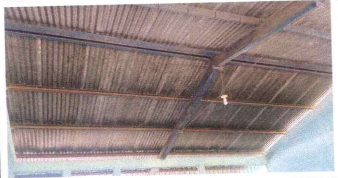
Foto 2: se observa el deterioro de las estructuras portante de las costaneras oxidado con necesidad de mantenimiento en su totalidad en el modulo 1