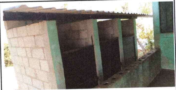
Foto 6: se observa el modulo de letrina y desprendimiento de pintura en las paredes con necesidad de mantenimiento en su totalidad en el modulo 2

Observación: Si es necesario se pueden agregar hojas adicionales y actualizar el número de hojas.