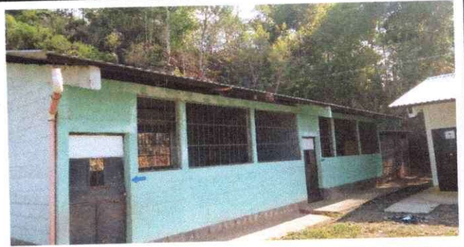
Foto 4: se observa el deterioro de canales y bajadas de agua pluvial parte de enfrente y atrás y desprendimiento de pintura en las paredes con necesidad de mantenimiento del edificio en el modulo 2