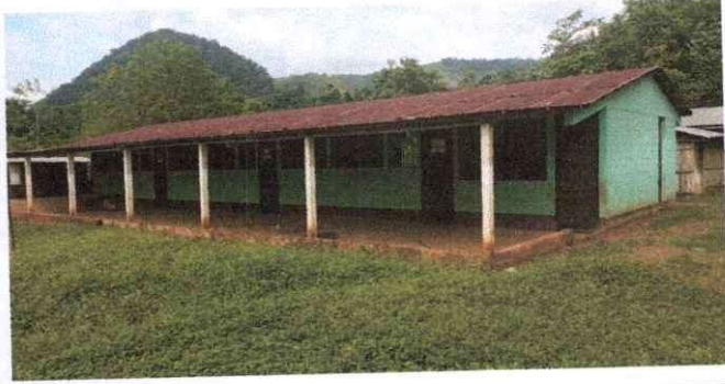
Foto 1: se observa el deterioro y oxidado de techos de las estructuras portante con necesidad de mantenimiento en su totalidad en el modulo 1